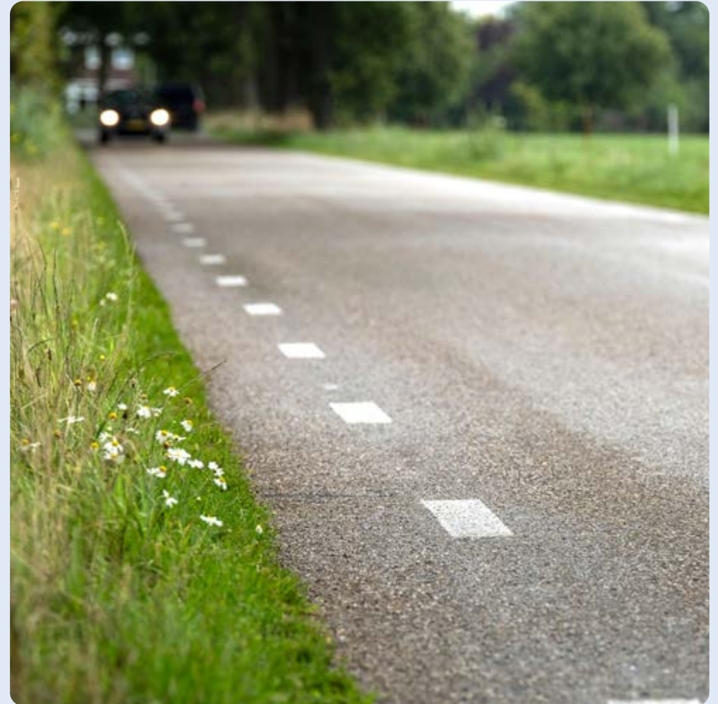
Broekland, kantbelijning 60 kmh aan de Van Dongenstraat