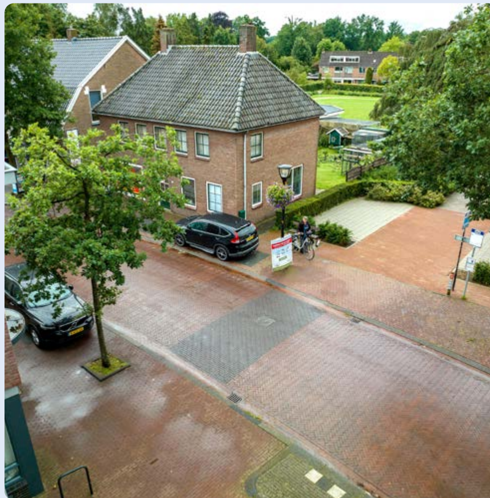
Heino, voetgangersoversteek Canadastraat ten hoogte van nummer 10 en 14

Eerder bestond ook de wens om een voetgangersoversteek aan de Stationsweg ter hoogte van de Kloostermanshof aan te brengen. Deze ingreep lijkt, in verband met de overzichtelijkheid op die plek, geen verbetering van de verkeersveiligheid. Bovendien kunnen bewoners van de Kloostermanshof via het Hof van Rakhorst rechtstreeks bij de voorziene oversteekplaats aan de Canadastraat komen.