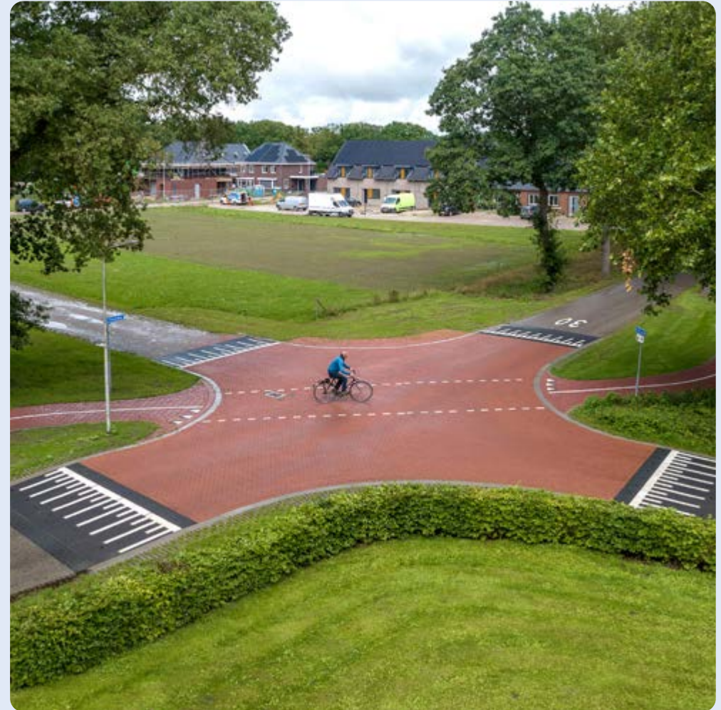
Luttenberg, kruising Heuvelweg - Kerkpad

Uit onderzoek en gesprekken in de buurt blijkt dat de omgeving en de basisschool waarde hechten aan het onverplichte fietspad. Daarom blijft deze bestaan. We hebben een plateau aangelegd en de fietsoversteek versimpeld. Als extra maatregel zijn er kanalisatiestrepen op het plateau gemaakt. Zo is het voor de overige weggebruikers ook duidelijk dat hier fietsers oversteken. Vooral snellere fietsers gebruiken de rijbaan.