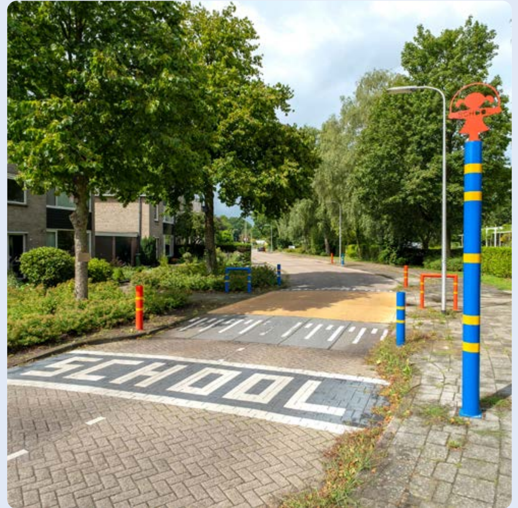
Raalte, schoolzone Hartkampweg

Er is een schoolzone gerealiseerd. Door de herkenbare inrichting wordt de weggebruiker geattendeerd op de aanwezigheid van de school. Dit zorgt voor een veiligere schoolomgeving. Ook kan de school makkelijker afspraken maken met ouders/verzorgers over het (parkeer)gedrag bij het halen/brengen.