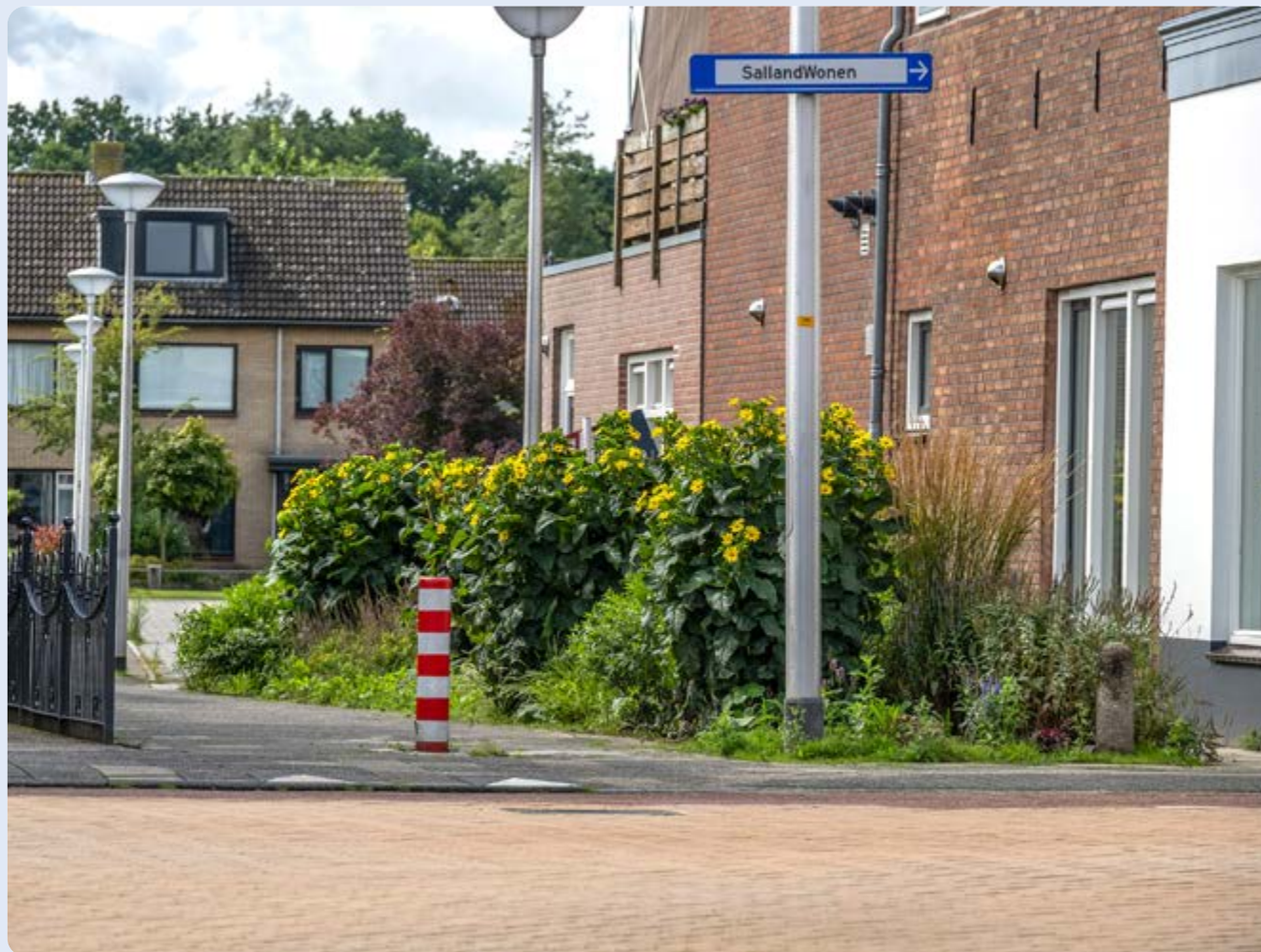
Raalte, Meidoornlaan - Brugstraat

Gedurende het hele jaar voeren we operationele werkzaamheden uit. Dit zijn kleine maatregelen waarmee we het ongemak/de lasten van inwoners en bedrijven beperken. Een voorbeeld is het realiseren van een blauwe zone (parkeerschijfzone) op twee parkeerplaatsen bij Bakkerij Bosgoed in Heeten. Een ander voorbeeld is het aanbrengen van beplantingen op de Brugstraat in Raalte ter hoogte van de fietsoversteekplaats vanaf de Meidoornlaan.