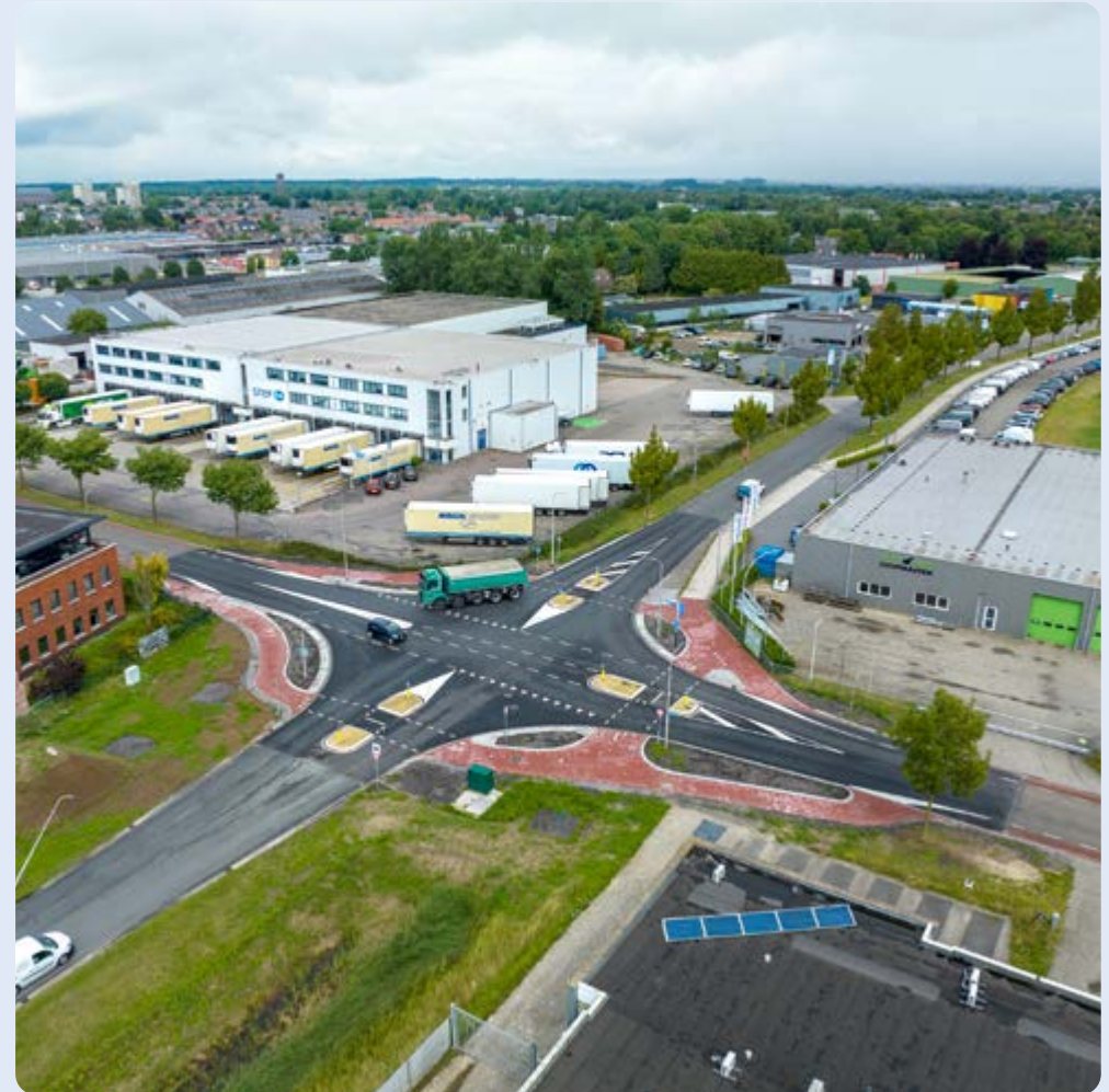
Raalte, Klipperweg - Kaagstraat

In het najaar van 2021 heeft een adviesbureau een verkeersstudie uitgevoerd op dit kruispunt. Dit leidde tot een ontwerp, dat in juni 2023 is gerealiseerd. Ter hoogte van het kruispunt is een fietspad naast de rijbaan aangelegd. Fietsers maken daardoor niet meer gebruik van hetzelfde wegvak als het gemotoriseerde verkeer. Op het kruispunt zijn middengeleiders geplaatst. Die geleiders hebben als doel om de snelheid, waarmee verkeer het kruispunt nadert, omlaag te brengen. Bovendien kunnen fietsers nu 'getrapt' oversteken. Omdat het aantal en de ernst van de ongevallen groot bleek te zijn heeft de provincie 75% subsidie bijgedragen aan de herinrichting.