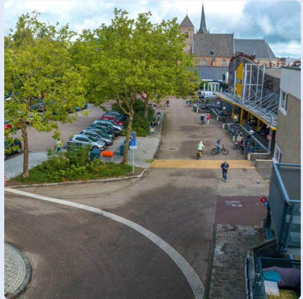
Raalte, herinrichting Domineeskamp

De openbare ruimte rond de losplaats is opnieuw ingericht, waarbij de groenstrook is aangepast. Een aantal parkeervakken is verwijderd en er is een nieuwe herkenbare route voor voetgangers aangeduid.