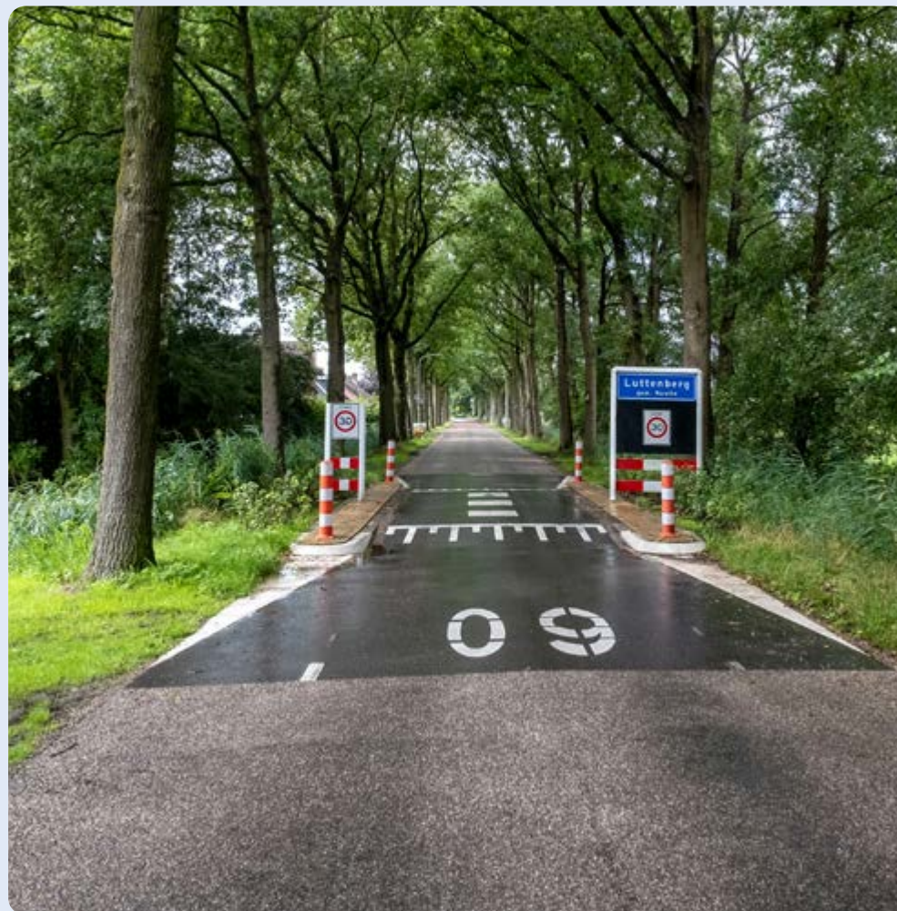
Luttenberg, wegversmalling Lemelerweg