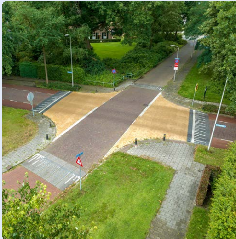
Raalte, kruising Zwolsestraat - Berkenlaan